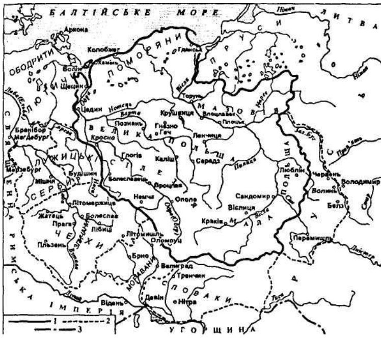
Польська ранньофеодальна держава на початку XIст.

"Землю полян" вважається басейн середньої течії річки Варти, аосновним адміністративним центром — "грод" Гне-зно. Приблизно з середини IX ст. полянами керували спадкові князі з роду Пястів, які згодом започаткували першу польську династію. Найдавніша польська хроніка ГаллаАноніма (початок XIIст.) зберегла легенду про те, як поляни за лиходійство, скоєне князем Попелем, вигнали з племені йогосамого та всіх його нащадків і за взаємною згодою проголосили вождем сина хлібороба Пяста — Земовіта. Земовіт об'єднав усі землі полян, які пізніше дістали назву Велика Польща. Його наступники — Лестек ісин Лестека князь Земомисл — намагалися підкорити сусідні племена й зміцнити свою владуна завойованих територіях. Однак простежити першіетапи процесу територіального зростання держави полян дужескладно. Більш-менш точні відомості про її розміри з'являються лише за часів правління сина Земомисла — МешкаI(бл. 960—992) — першогоісторично достовірного польського князя, про якого згадується в літописі.