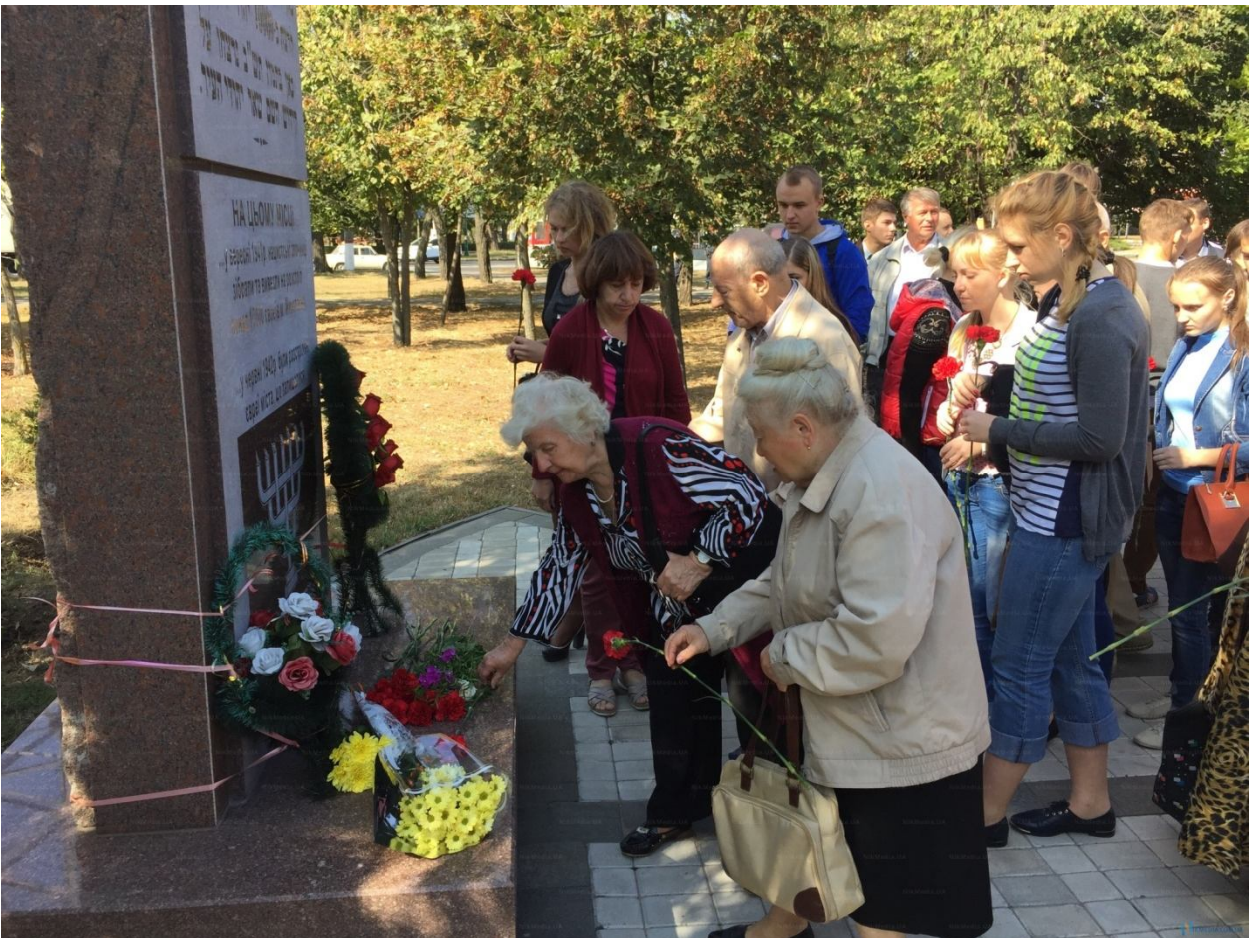
Покладання квітів до пам'ятника жертвам Голокосту в м. Миколаєві