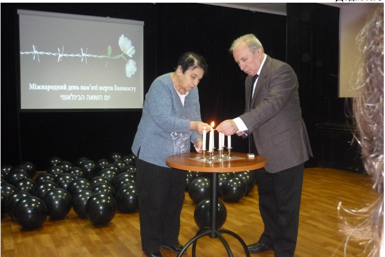
Концертний зал Миколаївського товариства єврейської культури. Захід до Міжнародного дня пам'яті жертв Голокосту (27.01.2020)