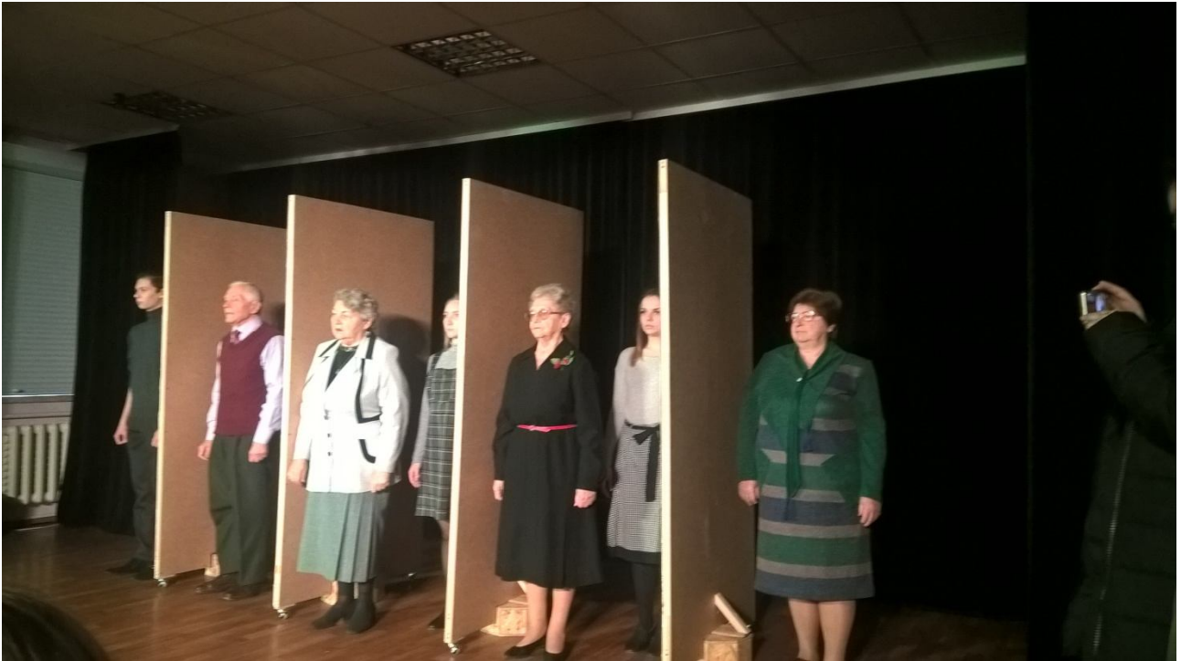
Фрагмент вистави «Театр очевидців»